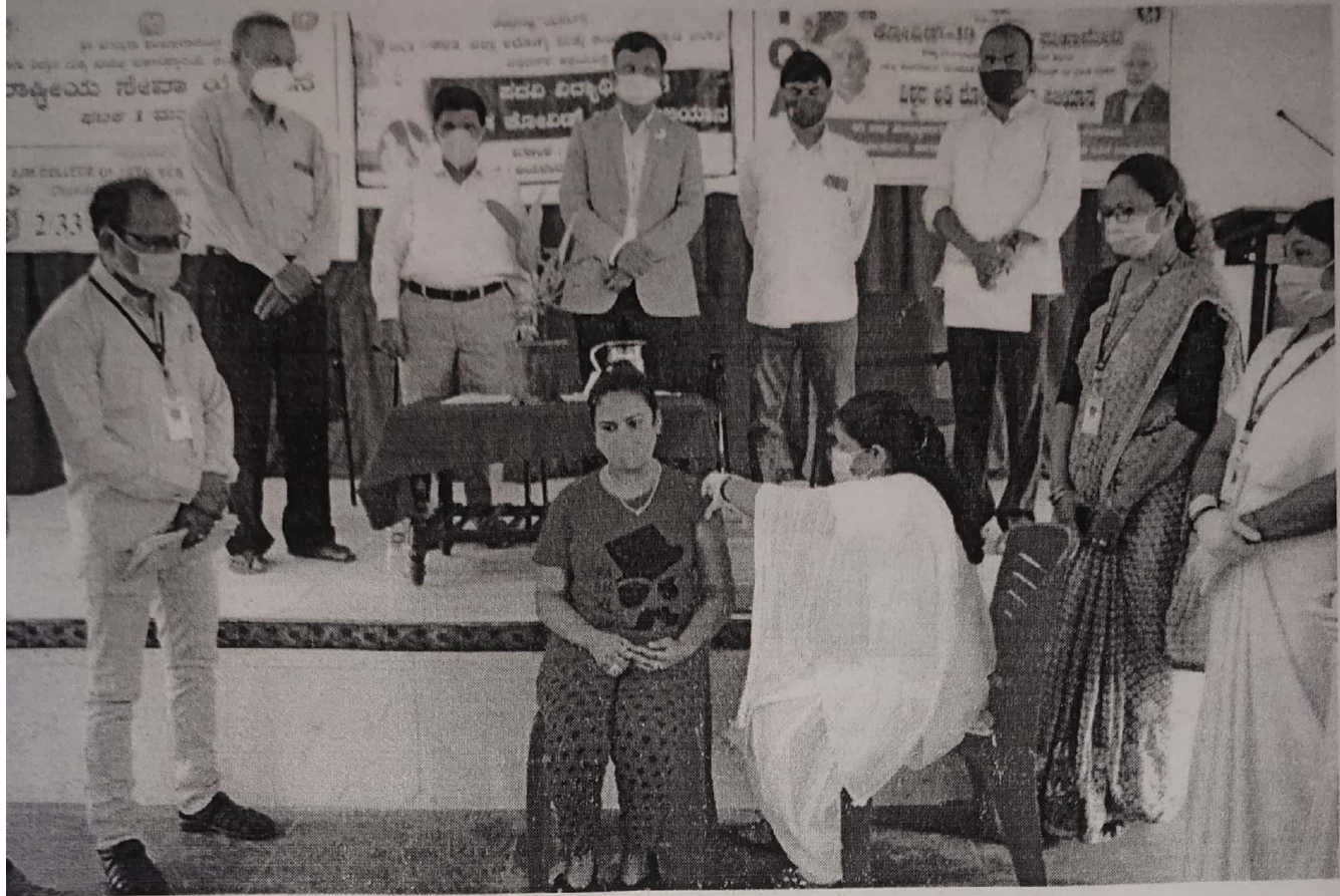
Students and general public are vaccinated Covi-Shield vaccination